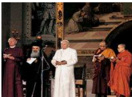
Jean Paul II à Assise le 27 octobre 1986

En référence à la rencontre de François avec le sultan, Jean Paul II choisit Assise pour un dialogue avec les représentants de toutes les religions, soulignant que l'on peut très bien affirmer son identité en dialoguant pour construire la paix et faire progresser l'humanité.